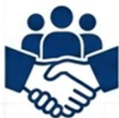
Tabela SUS Paulista

Sustenta 50% de toda a produção hospitalar do SUS paulista.